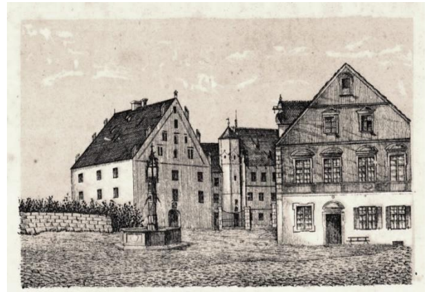
Blick auf die Schlösser und das Bräuhaus in Weißenhorn, um 1870

Bereits seit hundert Jahren residierten die Herren von Rechberg in Weißenhorn, ehe sie sich – anno 1460 – entschlossen, ein neues Schloss zu errichten. Ganz aus Stein gebaut überragte es einst mit seinem steilen Satteldach die städtische Fachwerksiedlung. Kaum vollendet, verließen die Rechberger jedoch Weißenhorn. Es folgten, ab 1507 die Fugger und mit ihnen kaiserliche Gäste – Maximilian I., dann Karl V. Für die war mehr Platz erforderlich und es entstand der „Weiße Bau“ – das Fuggerschloss, das mit einem Zwischenbau an den Rechbergbau angebunden wurde. Mehr als 300 Jahre pflegten die Fugger höfisches Leben in dem neuen Gebäudekomplex. Mitte des 19. Jh. übernahm die Stadt die Bauten und es folgten zahlreiche Umnutzungen, bis schließlich ab 2009 eine durchgreifende Generalsanierung erfolgte. Seit 2013 erstrahlen die Schlösser in neuem Glanz und bieten Raum für die städtische Verwaltung, für Kunst und Kultur und nun auch für kulinarischen Genuss. Dabei kann der Gast – zumindest in der warmen Jahreszeit – wählen zwischen