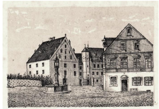
Blick auf die Schlösser und das Bräuhaus in Weißenhorn, um 1870

stimmungsvollen Räumen im Innern, einem gemütlichen Biergarten einem über der ehemaligen Stadtmauer und beschaulichen Platz auf dem Schlossplatz. Vollendet 2016 bildet er zusammen mit der Schlossgaststätte die Krönung.