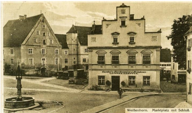
Blick auf die Schlösser und das ehemalige Bräuhaus um 1910

einem Zwischenbau an den Rechbergbau angebunden wurde. Mehr als 300 Jahre pflegten die Fugger höfisches Leben in dem neuen Gebäudekomplex. Mitte des 19. Jh. übernahm die Stadt die Bauten und es folgten zahlreiche Umnutzungen, bis schließlich ab 2009 eine durchgreifende Generalsanierung erfolgte. Seit 2013 erstrahlen die Schlösser in neuem Glanz und bieten Raum für die städtische Verwaltung, für Kunst und Kultur und nun auch für kulinarischen Genuss. Dabei kann der Gast – zumindest in der warmen Jahreszeit – wählen zwischen